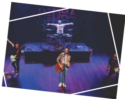
Pedra Leticia – O show Dia 14 de novembro (terça) Teatro GACEMSS 1 Público: 195 pessoas