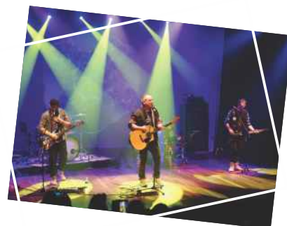
Show musical “ColdPlayers” Dia 18 de novembro (sábado) Teatro GACEMSS 1 Público: 144 pessoas