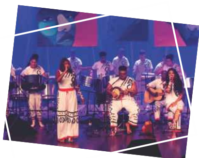
Show "Nossas Raízes" Tambores de Aço - Fundação CSN Cultura Dia 17 de novembro (sexta) Teatro GACEMSS 1 - Entrada franca Público: 82 pessoas