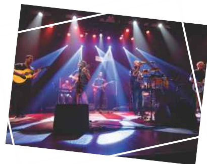
Show “Para Lennon & McCartney - os Beatles e o Clube da Esquina” Dia 15 de novembro (quarta) Teatro GACEMSS 1 Público: 217 pessoas